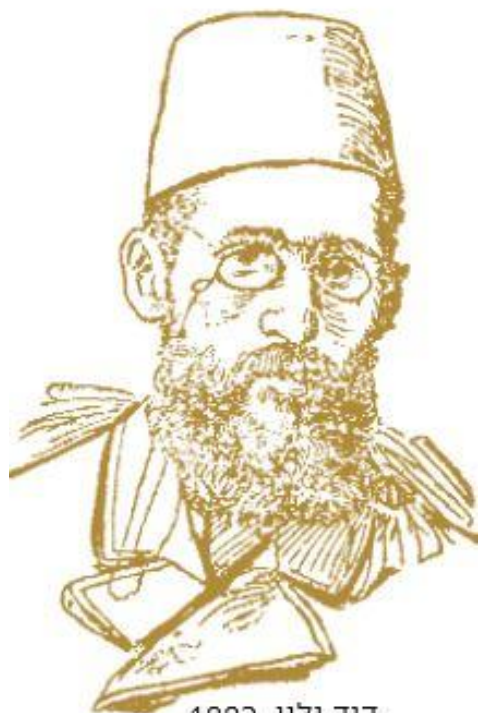
דוד ילין, 1882

דוד ילין קורות חייו ופועלו – אתר ויקיפדיה